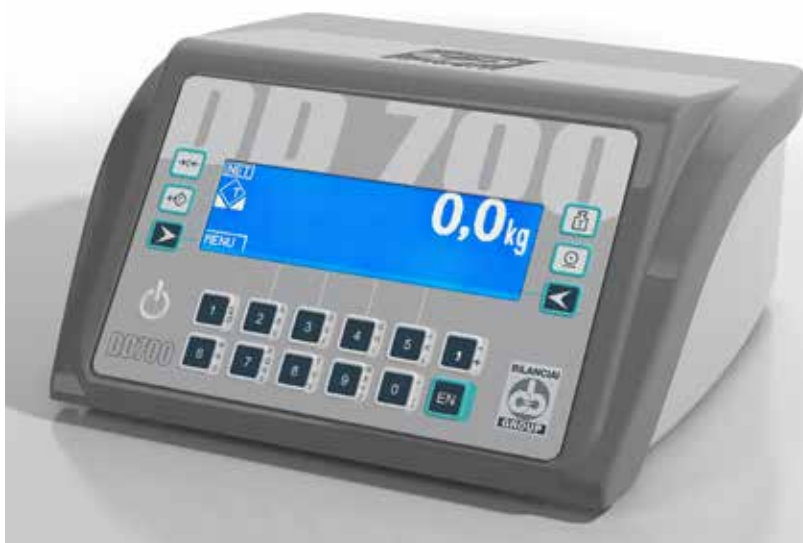
VERSIONE DA TAVOLO

Il tastierino alfanumerico o la tastiera USB opzionale semplifica l'attività dell'utente, rendendo il funzionamento più comodo e flessibile.