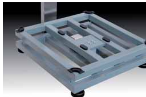
Particolare della struttura in acciaio verniciato