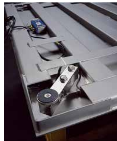
Alloggiamento cella di carico (particolare)