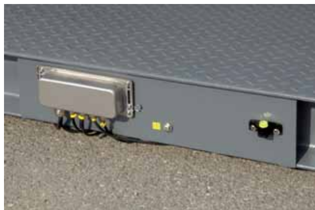
Scatola di giunzione in acciaio Inox