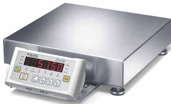
Versione compatta con D70E Compact version with D70E

* Non disponibile per il modello 300x240 / * Not available for 300x240 model