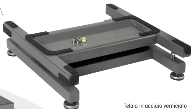
Telaio in acciaio verniciato Painted steel frame